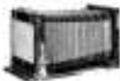
Elegant 12-18 cm 20-25 cm