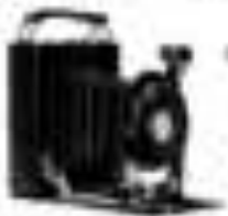
Heug IV 4 1/2 cm