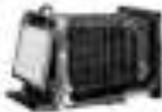
Hochtourist 12-18 cm, 20-25 cm, 28-35 cm