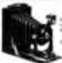
Volta 4 1/2 cm 8 - 12 cm

Vorteile: kleinstes Objektiv - kleinstes Gehäuse 4 1/2 cm hoch - 4 cm Durchmesser - kleinste Kamera der Welt Nr. 1091 4,5 - 9 cm ... 100 ... 100 Nr. 200 4,5 - 12 cm ... 100 ... 100 Nr. 100 6 - 12 cm ... 100 ... 100 Nr. 200 6 - 12 cm ... 100 ... 100