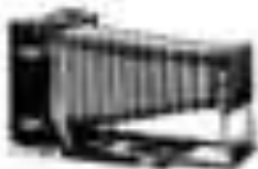
Kasmopolit 12-18 cm 20-25 cm