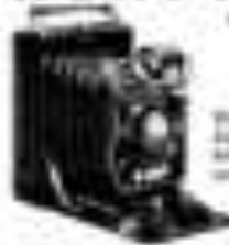
Niklas 4 1/2 cm 8 - 12 cm

Vorteile: kleinstes Gehäuse - kleinstes Objektiv - kleinste Kamera der Welt Nr. 100 4,5 - 9 cm ... 100 ... 100 Nr. 200 4,5 - 12 cm ... 100 ... 100 Nr. 100 6 - 12 cm ... 100 ... 100 Nr. 200 6 - 12 cm ... 100 ... 100