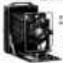
Icar 8 - 12 cm

Vorteile: kleinstes Gehäuse - kleinstes Objektiv - kleinste Kamera der Welt Nr. 100 8 - 12 cm ... 100 ... 100 Nr. 200 8 - 12 cm ... 100 ... 100 Nr. 100 12 - 18 cm ... 100 ... 100 Nr. 200 12 - 18 cm ... 100 ... 100