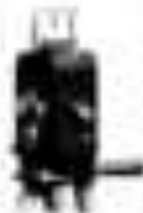
Zeiss Ikon KINAMO

Leichtestes und vorzügliches Kinamo-Kamera-Modell in der Markt-Reihe für Studios und kleine Kameras für den professionellen Betriebsbetrieb und