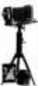
Raupp-Camera 12-18 cm