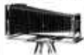
Perfekt 12-18 cm